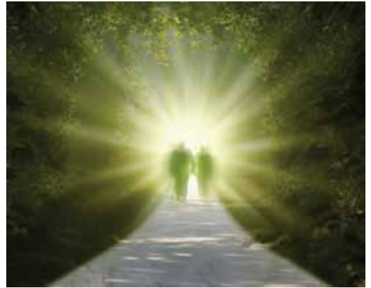
Sommige mensen gaan in een BDE door een tunnel naar het licht, horen stemmen en ontmoeten andere wezens

Voor een BDE hoeft men dus niet persé bijna dood te zijn. Veel mensen krijgen deze ervaring na het innemen van bepaalde stoffen, als ze moe zijn en zelfs tijdens gewone werkzaamheden. Neurologisch gezien ontstaat deze toestand, omdat het bewustzijn de oriëntatie kwijtraakt. Dit komt ook voor bij epilepsie en de remslaap. Mensen met een tijdelijke hallucinatie (door bijvoorbeeld extreme euforie) en piloten die aan zeer