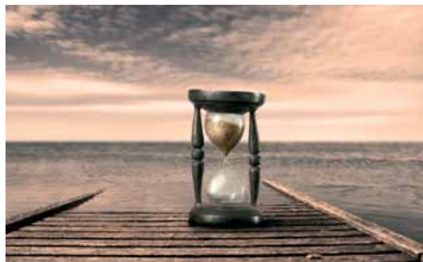
De tijd dringt tot spoed

Het lijkt erop dat veel mensen tegenwoordig geneigd zijn om zich afzijdig te houden. Ze laten dan de aanvallen van de boze op het christelijk erfgoed langs zich heen gaan. Inmiddels draait de 24-uurs economie op volle toeren en vaak moeten beide ouders werken om de maandelijkse lasten te kunnen betalen. Veel werkgevers misbruiken deze tijd en eisen veel van hun werknemers: altijd meer, altijd beter . . . Carrière, beter gezegd werk houden, is tegenwoordig het motto.