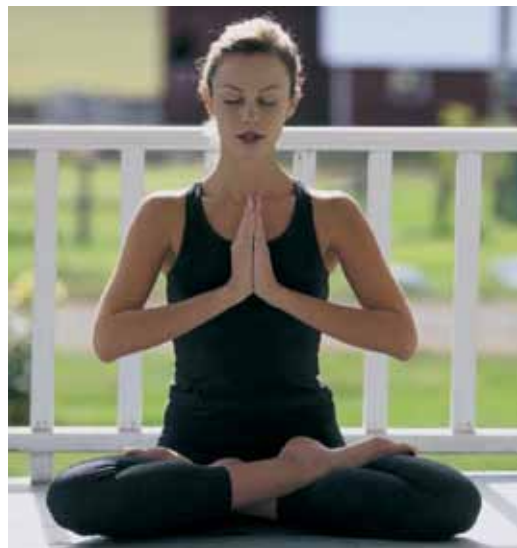
De typische uit Oosterse religies stammende houding

Men moet zich op een rustige plaats terugtrekken, gemakkelijk, rechtop/kaarsrecht zitten of staan; de ogen sluiten; (het ritme van) de ademhaling controleren; de handpalmen ten hemel openen, met de vingers een cirkel maken (mudra's); de tong tegen het harde verhemelte leggen; mantra's (zoals bijv. de lettergreep OM) reciteren; voorstellingen voor het innerlijke of geestelijke oog visualiseren. Men moet de spieren strekken of stretchen, in afwisseling aan- en ontspannen.