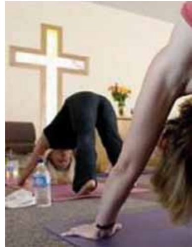
Yoga-oefeningen in een kerk

Tegen deze achtergrond rijst in uiterst scherpe bewoordingen de vraag: Wat is yoga? Wat is yoga echt? Kunnen en moeten gelovige christenen en hun kinderen yoga beoefenen?