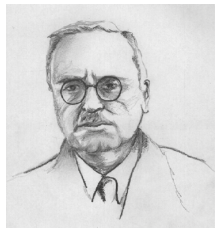
Alfred Adler

tussen volwassenen bewegen waardoor het tot ongewenste compensatie kan komen.