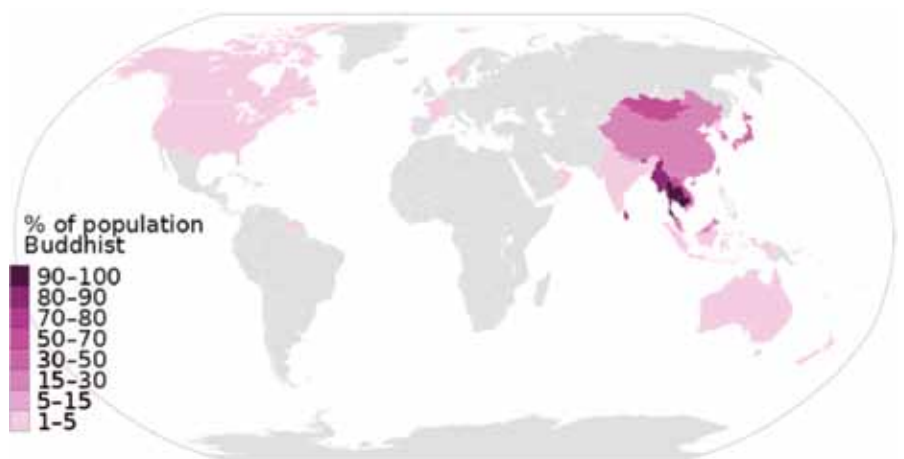
Percentage boeddhistische bevolking