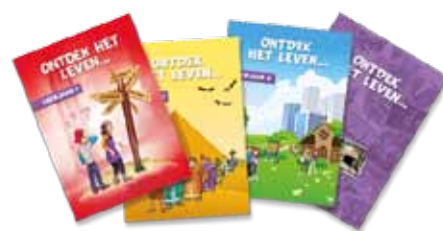
Een Bijbelgetrouwe godsdienstmethode (zie website B&O)

“ Kennis opdoen zonder de leidraad van onze Schepper in alle facetten van het onderwijs maakt de mens stuurloos. ”