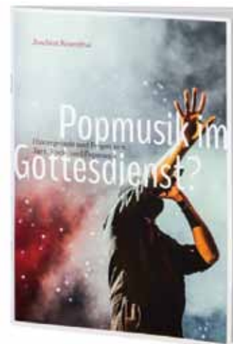
Zie eindnoot 1

Een belangrijke referentie in de beoordeling van popmuziek vinden we in de naams-oorsprong van de termen jazz en rock. "De term jazz is ontstaan in de Crib Houses. Het echte werk daar was prostitutie. In het Cajan-dialect van Louisiana worden prostituees "jazzbells" genoemd, een slechter maken of een belachelijk maken van het woord Jezebel (Izebel, de onaangerode)" ( Was du über Popmusik wissen solltest , Urs Rotach, Das Haus der Bibel, Zürich, 1980, p. 19).