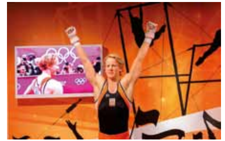
Epke Zonderland in Madame Tussauds Amsterdam

Televisiekijken door kinderen is de afgelopen decennia verschoven van een gezinsactiviteit naar het individueel kijken en dan met name op de mobiele telefoon. De televisie geeft een schijnwerkelijkheid weer, omdat de beelden in scene zijn gezet. Meer dan twee uur per dag voor de televisie was ‘normaal’ in Nederland. De 50-plusser kijkt nog meer, maar bij de jeugd is de absolute winnaar in kijkgedrag YouTube. 4 Tieners kijken nog maar 50 minuten per dag naar de televisie. Ik hoorde een journalist voor de radio zeggen, dat als zijn tienkinderen niet binnen 15 minuten