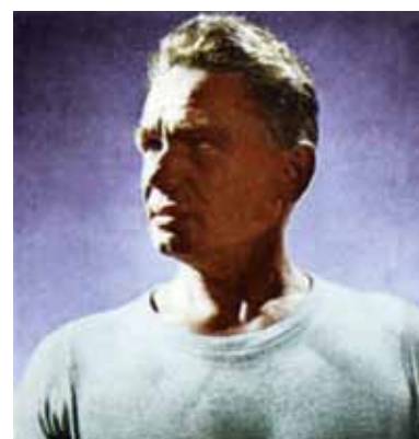
Joseph Hubert Pilates (1883-1967)

Gedurende deze tijd ontwikkelde hij het concept van een holistische 5 lichaamstraining, die zou moeten bijdragen aan een goede lichaamsbouw en lichaamshouding, allereerst voor soldaten die samen met hem geïnterneerd waren. Hij bestudeerde oosterse trainingmethoden zoals yoga en zenmeditatie, evenals bewegingen van dieren. Hij onderwees zijn medegevangenen in de methode die hij had ontwikkeld door hen op matrassen te trainen. Pilates keerde na de oorlog terug naar Duitsland en werkte daar met belangrijke vertegenwoordigers van de kinematica (= bewegingsleer), zoals Rudolf von Laban, een dansleraar. Deze legt in zijn geschriften de basis van zijn theorie uit, volgens welke de danser door de harmonie van lichaam, geest en ziel een harmonieuze verbinding met het universum ervaart die hij artistiek uit kan drukken.