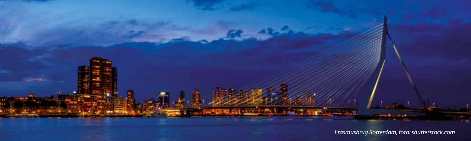
Erasmusbrug Rotterdam