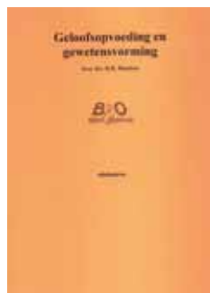
Geloofsopvoeding en gewetensvorming, edukatern, € 1,50

Het huwelijk is niet alleen een burgerlijke instelling, hoewel het onbetwistbaar correleert met welvaart. Het huwelijk is fundamenteel meer een goddelijke instelling. Man en vrouw schiep Hij hen om gezinnen te vormen, zodat een volgende generatie Hem ook verhoogt. Je hebt geen samenleving zonder het gezin en je hebt geen gezin zonder huwelijk. Onze radicaal vooruitstrevende samenleving draait op geleend sociaal kapitaal evenals op families die Bijbels standhouden, ondanks de heersende ideologieën van de dag. We moeten herinvesteren in gezinnen en in het huwelijk en daardoor investeren we in niets minder dan gerechtigheid voor onze samenleving. ■