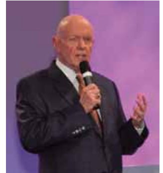
Stephen Covey

Hoewel hij naar alle wereldgodsdiensten verwijst, incl. het christendom, moet een dergelijk expliciet ontkennen van het eeuwige evangelie ons grote zorgen baren als zijn leer en methodes in onze christelijke scholen worden ingevoerd. Om brede ingang te vinden heeft hij de pragmatiek vermengd met christelijke, joodse en