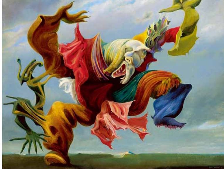
Max Ernst, L'Ange du Foyer ou le Triomphe du Surréalisme (1937), private collection

De moderne media maken hier via computertechniek ook veelvuldig gebruik van. Onze zintuigen sturen impulsen door naar ons brein. Door werkelijke of gemanipuleerde beelden en geluiden via onze zintuigen tot ons te nemen verandert ons beeld van de