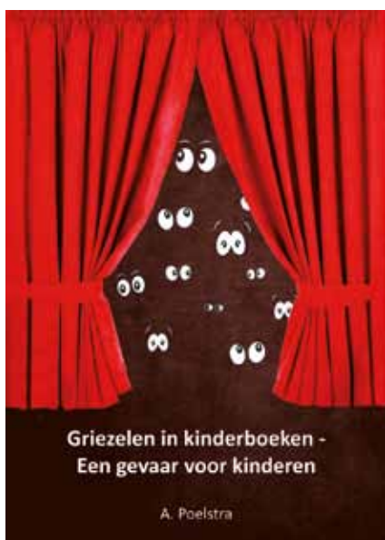
Bovenstaande brochure is nog verkrijgbaar in onze webshop.