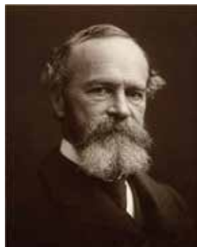
William James

De Schotse Verlichtingsdenker David Hume gaf in de 18 e eeuw al aan dat het belangrijk is hoe de mens over zichzelf denkt omdat dit zijn motivatie bepaalt en hem helpt om zijn volledig potentieel te benutten. Als je denkt iets niet te kunnen dan zal het je ook nooit lukken. De vader van de Amerikaanse psychologie William James (1842-1910) werkte dit verder uit met zijn theorie over 'chance and choice' (kans en keuze) . Sommige mensen krijgen niet dezelfde levenskansen als andere mensen maar naast de kansen, die dus niet beïnvloedbaar zijn maar die je wel moet opmerken, zijn er keuzes en die maak je zelf . Deze houding van een individu ten opzichte van zichzelf en hoe deze gevormd wordt is vandaag de dag nog steeds de grondslag van het denken van self esteem. James kwam uit een familie die Emanuel Swedenborg navolgde, een mystieke stroming waarbij reizen naar zowel de hemel als de hel en contact met engelen en demonen worden gepraktiseerd. Gedurende zijn leven streefde hij mystieke ervaringen na onder invloed van primitieve chemische middelen waaronder lachgas. Ik vermeld dit omdat we ook bij Freud een duidelijke invloed van drugs zoals cocaïne zien.