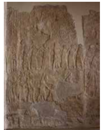
Lachish Reliefs

Deze twee Bijbelboeken laten zien dat God soeverein is, en Hij doet wat Hij wil. Laten wij dus niet pretenderen dat wij God het recht moeten geven om te handelen. God is echt niet onder de indruk van een uitgesproken gebed in de niet bestaande hemelse rechtbanken. Integendeel, deze leer van de hemelse rechtbank laat een totaal verkeerd mensbeeld en godsbeeld zien.